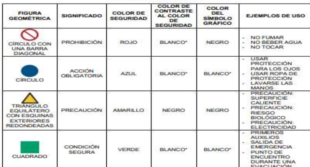
TABLA 1 – Figuras geométricas, colores de seguridad y colores de contraste para señales de seguridad